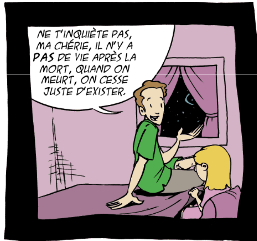
Papa explique pourquoi il n'y a pas de fantômes sous mon lit.